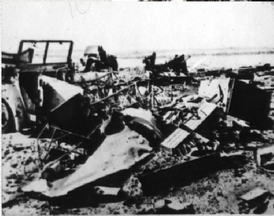
Остатки фашистской техники после разгрома под Тулой