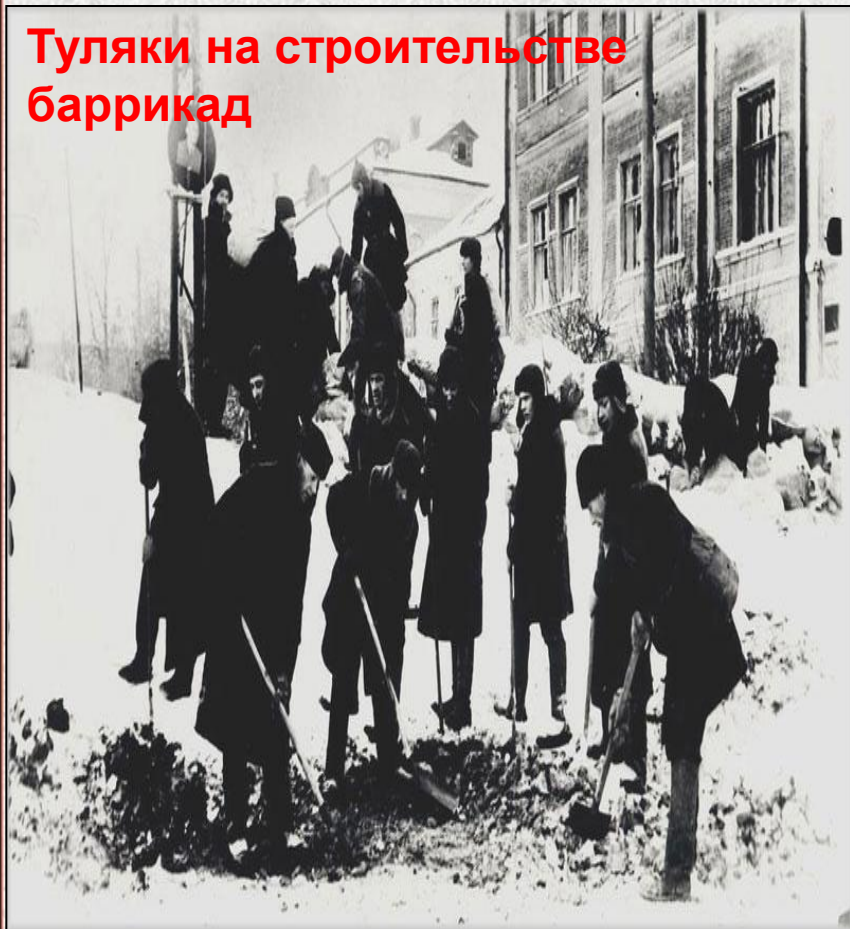
Туляки на строительстве баррикад